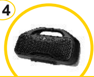
Sistema audio BRP