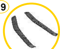
Tappetini zigrinati per vano piedi