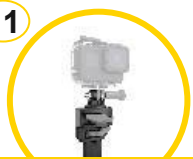
Supporto per fotocamera