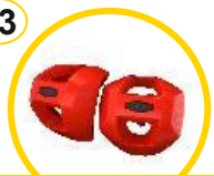
Parabordi LinQ Lite