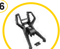
Impugnatura per osservatore e supporto per fotocamera