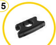
Adattatore galloccie a due punti