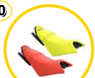
Sedili 2 UP